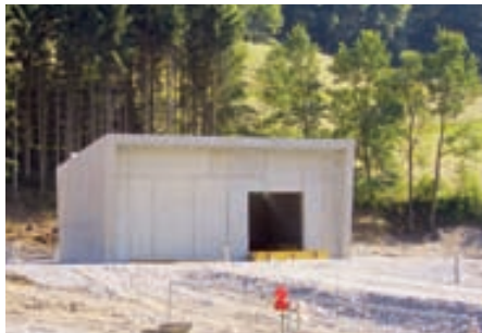
Der Rohbau des neuen Pumpwerkes

Auch bei der öffentlichen Abwasserbeseitigungsanlage wurde wieder mit einem neuen Bauabschnitt begonnen. Dieser erfasst die Erschließung der noch verbliebenen Gebäude in Schildried sowie den Ortsteil südlich der Gemeindestraße Büttels. Billigstbieter für diesen Kanalbauabschnitt BA10 war wiederum die Firma JägerBau aus Schruns. Die Gesamtkosten für dieses Projekt betragen zwei Millionen Euro. Die Arbeiten sollen bis Ende 2008 abgeschlossen werden.