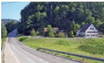
Der neue Damm zur Siedlung Schildried mit der neuen Berggasse