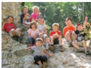
Kinder des Kindergartens erobern die Ruine Sigberg