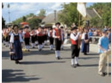
Der Musikverein Göfis beim historischen Festumzug in Bad Blumau