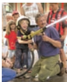
Der Kindergarten auf Besuch bei der Gölfner Feuerwehr, die vom 7. bis 9. September 2007 das 130-jährige Bestehen mit einem großen Fest beim Feuerwehrgerätehaus feiert.