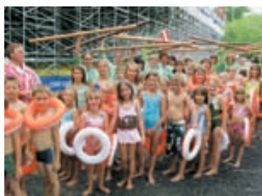
Einige der Teilnehmerinnen der Turnerschaft Göfis bei der Eröffnung