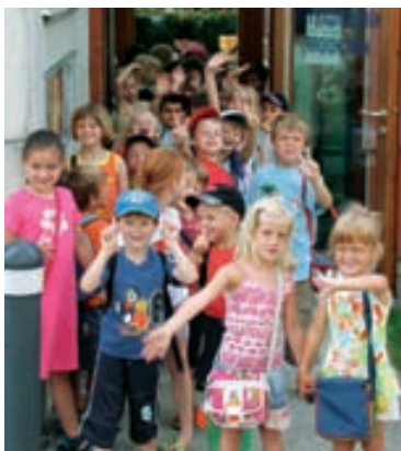
Kinder aus dem Kindergarten Kirchdorf freuen sich auf die Ferien.