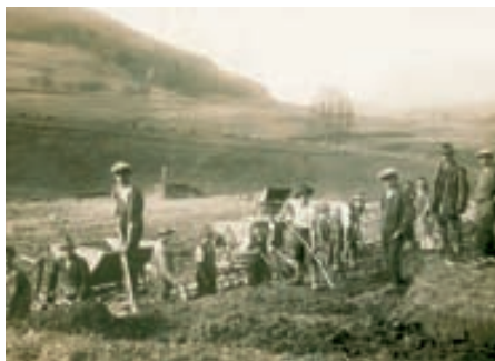
Straßenbau Richtung Dums, im Hintergrund das noch unverbaute Badida