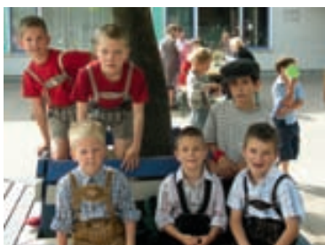
Kinder der Volksschule Agasella anlässlich des Schulprojektes in Schulkleidung wie vor 50 Jahren.