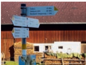
Der Jakobsweg führt über den Walgauweg in Pfitz und Tufers durch Göfis