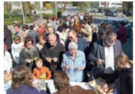
Agape nach dem Gottesdienst mit der Autosegnung

Eine Einsatzstunde des Mobilen Hilfsdienstes kostet 8,50 Euro, an Sonn- und Feiertagen wird ein Zuschlag in Höhe von 50 Prozent verrechnet. Für die Einsätze stehen 19 geschulte Helferinnen zur Verfügung.