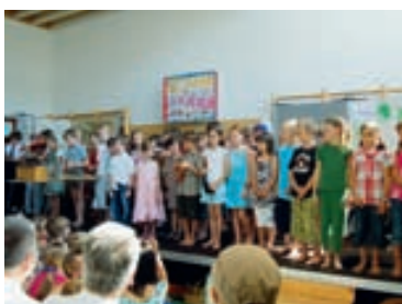
Die Kinder Volksschule Agasella führten ein tolles Programm beim Jubiläumsfest vor.