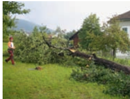
Vom Feuerbrand befallener Birnbaum beim Arzthaus

Feuerbrand ist eine sehr gefährliche und hoch ansteckende bakterielle Pflanzenkrankheit, die sich in den letzten Jahren in Vorarlberg in fast allen nichtalpinen Gebieten verbreitet hat. Seit 2007 kann nicht mehr von Infektionsherden im Land gesprochen werden. Vielmehr ist von einem fast flächendeckenden Vorkommen des Bakteriums auszugehen, mit dem es künftig zu leben gilt.