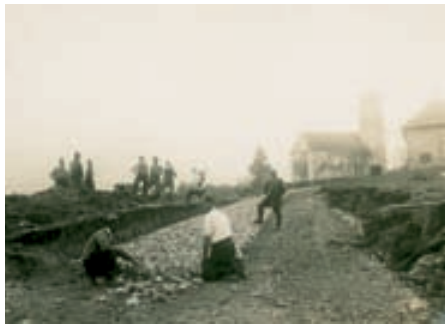
Straßenbau vom Dorfzentrum Richtung Dums Anfang der 1930er-Jahre

Nachdem ich die Schalung für die 40er-Kellermauern angefertigt hatte, besorgte ich Kies und Steine aus der Ill