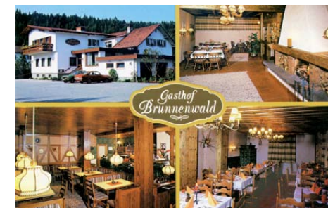
Ansichtskarte um 1980

Im Jahr 1979 erfolgte ein erster Umbau der Gasträume mit einer Vergrößerung auf zirka 120 Sitzplätze. Anlässlich „35 Jahre Gasthof Brunnenwald Gölfis“ veranstaltete das Wirtspaar ein großartiges Fest mit dem Musikverein Beschling und einem bekannten Unterhaltungsmusiker, zu dem Nachbarn, Stammgäste, Freunde und Bekannte aus Gölfis und Umgebung eingeladen waren. Freiwillige Spenden stellten die Wirtsleute dem Krankenpflegeverein Gölfis zur Verfügung.