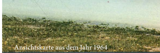
Ansichtskarte aus dem Jahr 1964